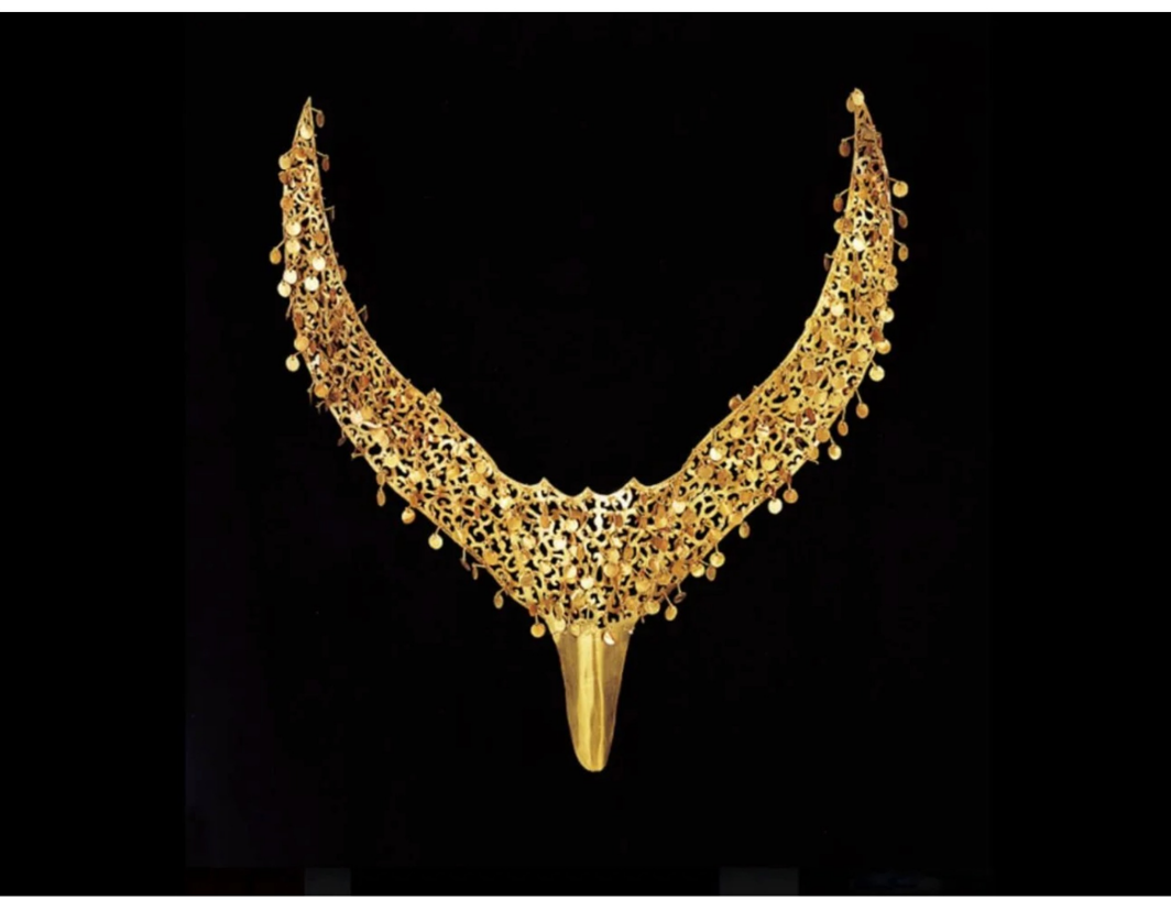
Ornement en forme d'aile pour une couronne

Cette année, le Printemps Asiatique Paris rend hommage à l'art coréen, alors même que la Corée du Sud connaît un rayonnement culturel des plus éclatants. Rendez-vous du 3 au 12 juin dans les nombreuses institutions parisiennes et du 4 au 8 juin à la galerie Charpentier pour un voyage haut en couleur.