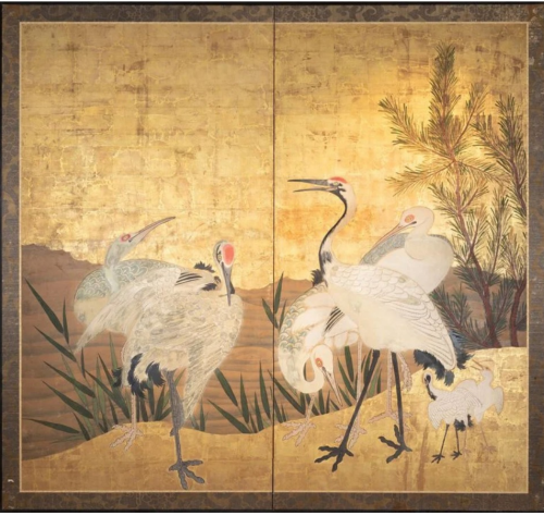
Paravent à deux volets avec des grues, Période Edo (XVIIIe siècle)

Dans toute la capitale, un parcours culturel se déploie en écho. Immanquables, les expositions du musée national des Arts asiatiques - Guimet se complètent, entre héritage millénaire et créativité en ébullition.