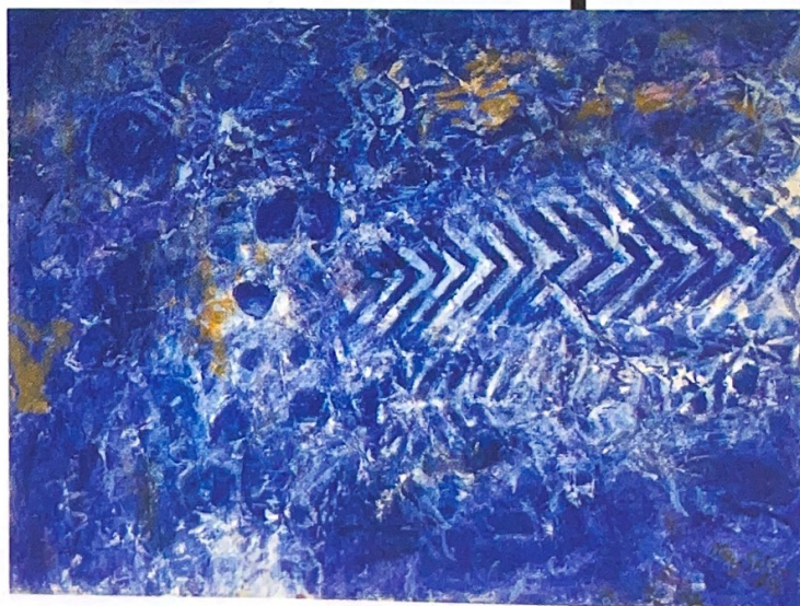
Key Sato Sans titre , 1969, encre sur papier, 25 x 32 cm GALERIE LOUIS & SACK, PARIS.

« Le critique d'art Pierre Restany a qualifié les gouaches de Key Sato (1906-1978) de "Rêveries géologiques" », rappelle Aude Louis Carvès, qui présente avec son binôme Rebecca Sack plusieurs artistes japonais de la deuxième École de Paris. « Les pierres, la terre et les fossiles sont à la source de sa création. Ses œuvres abstraites sont marquées de traces et de symboles ; elles sont longuement exécutées, par couches de gouache successives, rugueuses comme des sédiments. Dans cette encre, il parvient à recréer la matière d'une gouache en relief. »